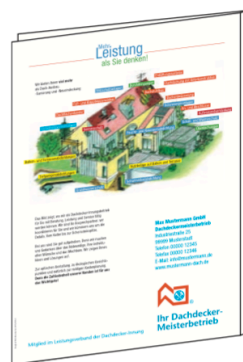
Werbemappe – Rückseite