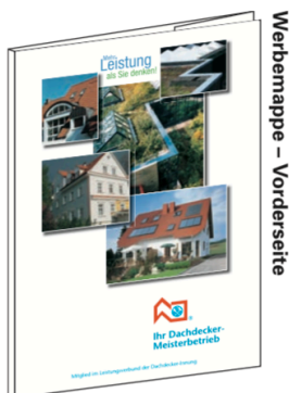
Werbemappe – Vorderseite

Achtung: Die Aktion endet am 13. Oktober 2017. Durch die Sammelbestellung kann ein besonders günstiger Stückpreis, auch bei kleinen Auflagen, erzielt werden. Das Bestellformular wurde unserer Verbandszeit-